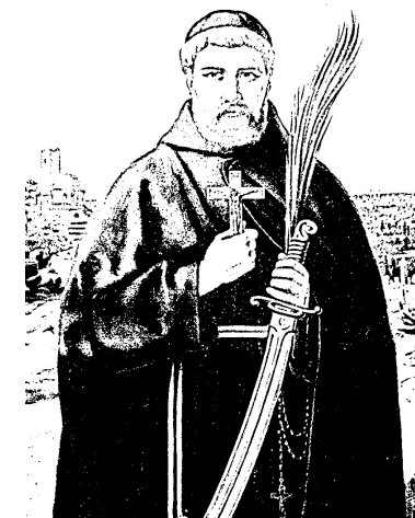
Bild: Hl. Engelbert Kolland

im Pfarrbüro Mittersill unter der Tel.: 06562/6235 Kosten für die Busfahrt: 25,00 Euro