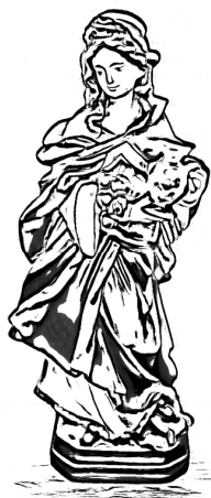
Bild: Bild: Sarah Frank | factum.adp Pia Schüttlohr Bild: Bianka Leonhardt / www.kinder-regenbogen.at Text: Frank Greubel In: Pfarrbriefservice.de

m.E.v. Bruder Toni *Elfriede Höhenwarter z. Gebt.